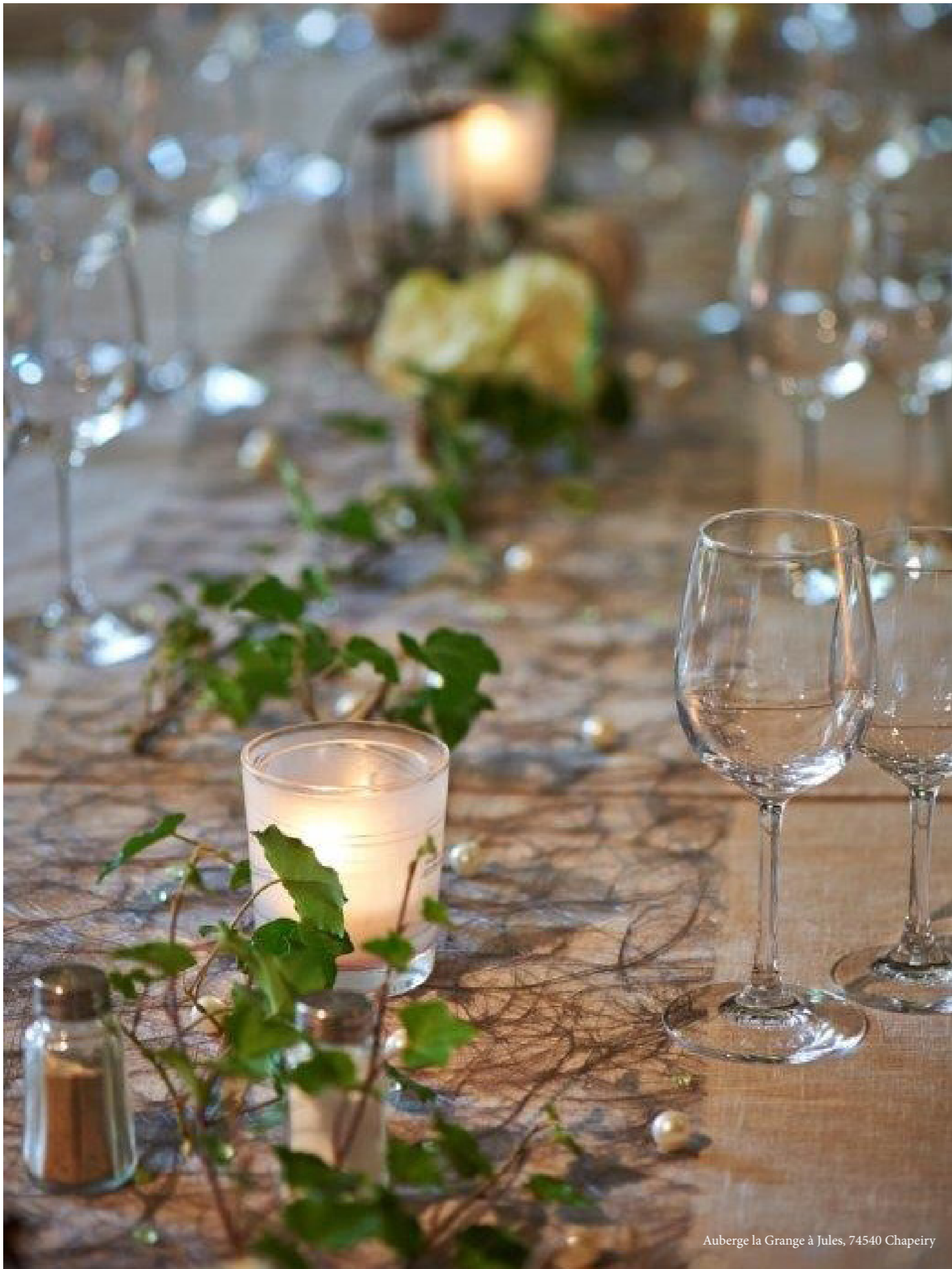
Auberge la Grange à Jules, 74540 Chapeiry