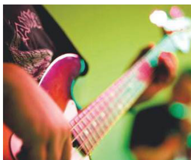
Programme mensuel des animations