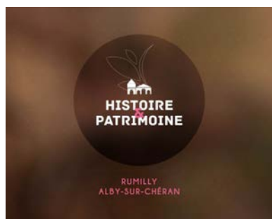
Histoire et patrimoine