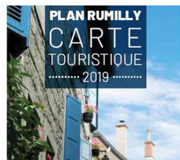
Carte touristique et plan de ville