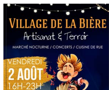
Divers supports de com'